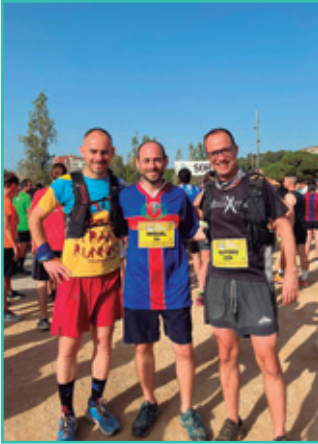
Cursa Popular de Les Santes 2024