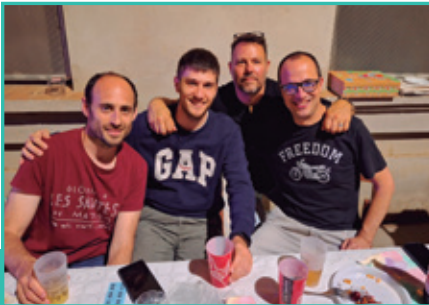
Mataró és viu als barris, un any més el sopar de L'Havana.