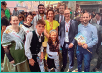
Anada a l'Ofici Les Santes 2024. Preservació i el foment de les tradicions catalanes. Visca el pubillatge!