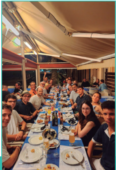
Sopar de l'equip per inaugurar Les Santes.

Carrer Unió, 13, 08302 Mataró, Barcelona ATENCIÓ A LA CIUTADANIA: 620 11 86 45 www.juntspermataro.cat